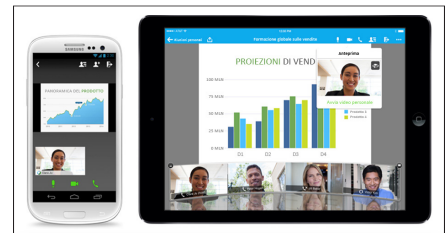
Figura 3. Possibilità di partecipare a riunioni da qualsiasi dispositivo

Esperienza di riunione coinvolgente con audio, video e condivisione dei contenuti su dispositivi Android, iPhone, iPad, BlackBerry 10 e Windows Phone 8.