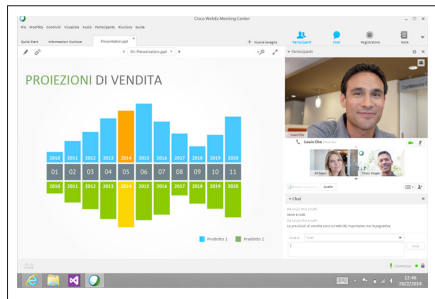
Figura 1. Condivisione dei contenuti durante una riunione

Condivisione in tempo reale dei contenuti o dell'intero schermo con i partecipanti remoti. Trasferimento del controllo ai partecipanti per condividere contenuti o aggiungere note ai documenti dell'ospite. La figura 1 mostra un esempio di condivisione di contenuto con l'oratore attivo e gli altri partecipanti alla riunione.