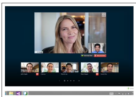
Figura 1. Visualizzazione in modalità a schermo intero